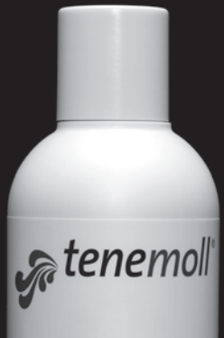
WOLLE CASHMERE ALPAKA