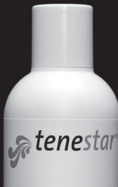
SEIDE SEIDE-MISCHGEWEBE VISCOSE