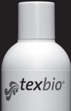
LEINEN BAUMWOLLE RAMIE

Wertvolle Textilien schonend aber doch gründlich sauber zu waschen ist der Wunsch aller, die sich und ihrer Haut etwas Gutes tun wollen. INTERVALL-Spezialprodukte kommen diesem Wunsch in vollem Umfang nach: Gründliche, hautfreundliche Wäsche ohne Phosphate, optische Aufheller und Bleichmittel, gut biologisch abbaufähig. Farben bleiben leuchtend, die wertvollen Eigenschaften der Natur- sowie der Microfasern bleiben erhalten. Erhältlich in allen guten Fachgeschäften.