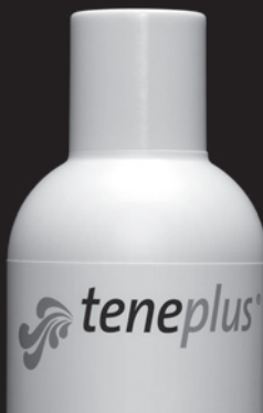
MICROFASERN ALLE SYNTHETICS